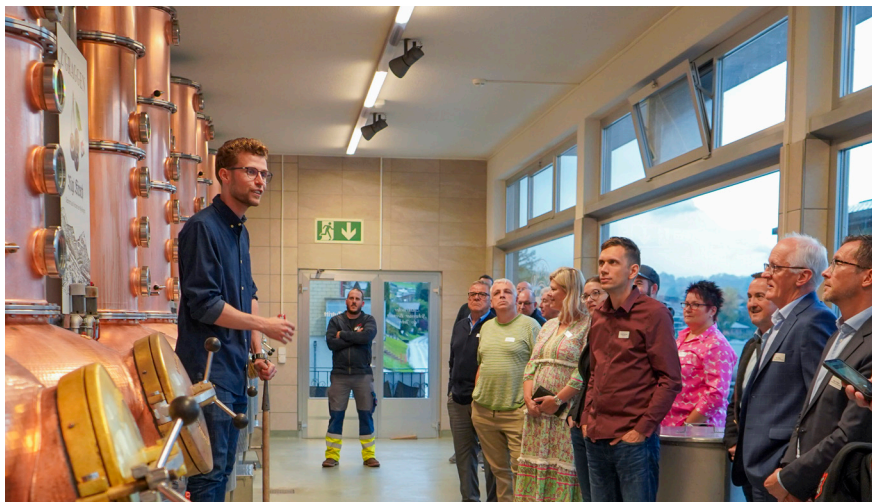
10. Trendtrëff bei der Distillerie Z'Graggen

Am 10. Trendtrëff wurden aktuelle Entwicklungen in der Gasbranche behandelt. Am Anlass vom 24. Oktober 2023 war allen Teilnehmerinnen und Teilnehmern klar: es wird höchste Zeit für erneuerbare Gase. Nach den interessanten Kurzreferaten konnten die Teilnehmer/innen eine Führung durch die Distillerie Z'Graggen in Laurenz machen. Bei der anschliessenden Degustation wurde rege diskutiert und die verschiedenen Destillate genossen. Alles in allem ein gelungener und informativer Trendtrëff.