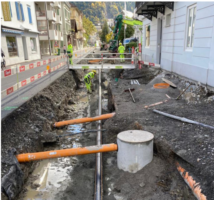
Sanierung Gersauerstrasse in Brunnen

Beim Mythen Center Schwyz führen wir alle zwei Jahre Leistungen im Rahmen der Wartungsarbeiten für die Grundwasserpumpen aus.