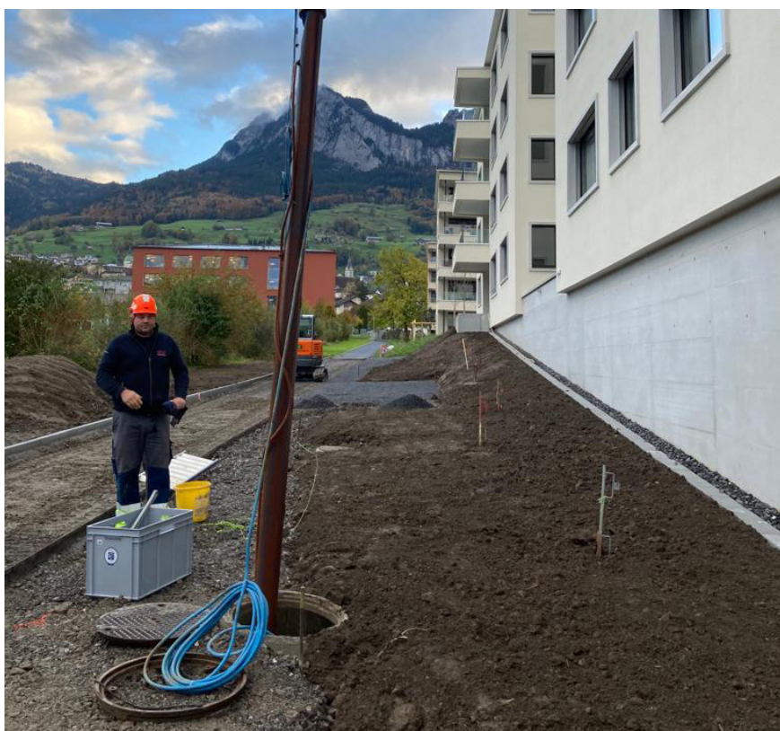
Demontage der Grundwasserpumpe beim Mythen Center in Ibach